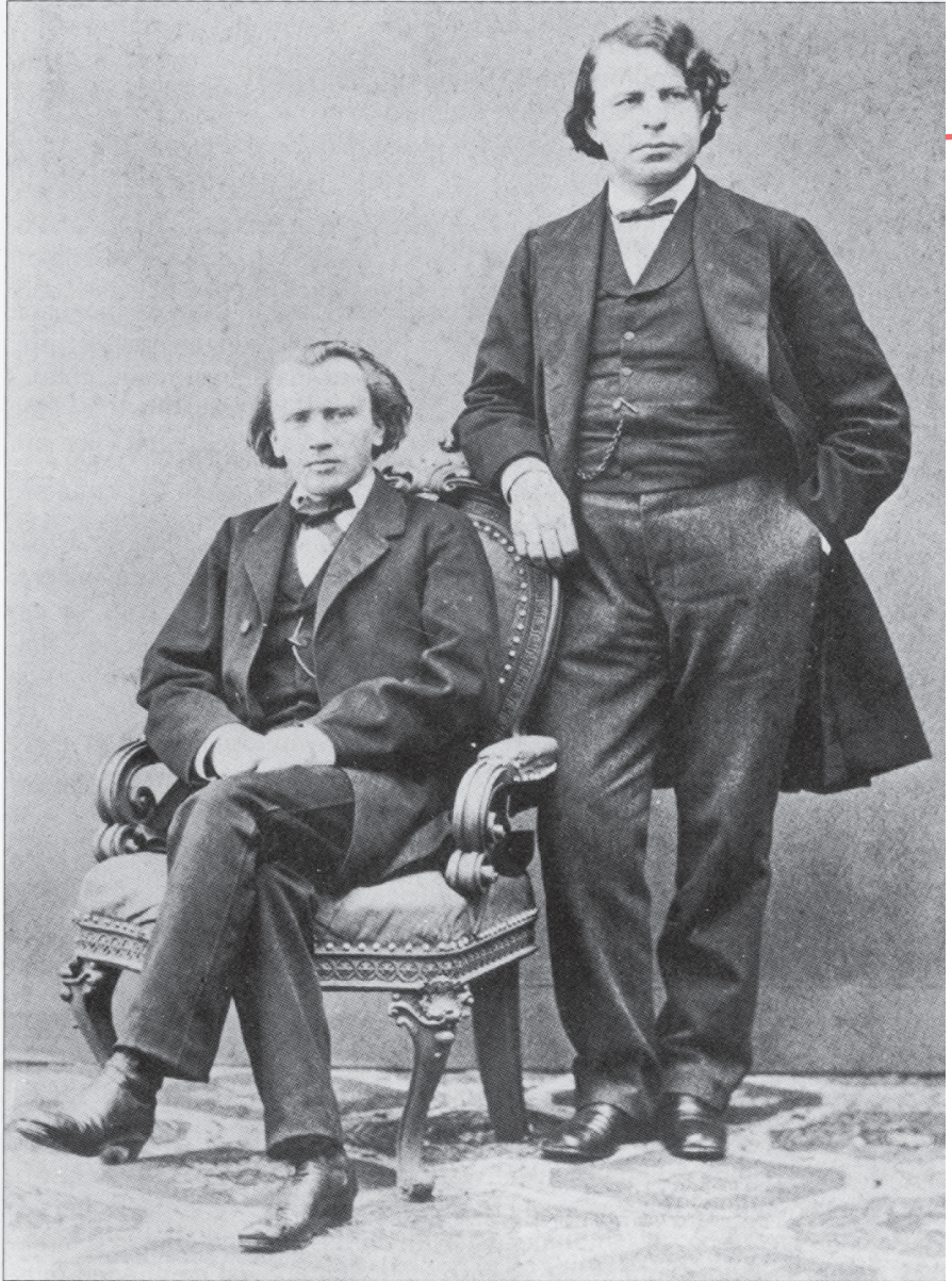
Joseph Joachim und Johannes Brahms