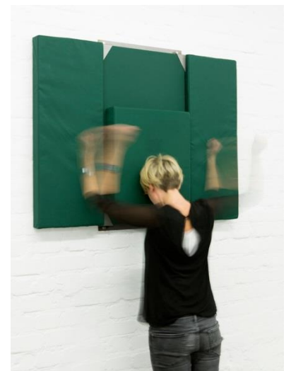
Mary Audrey Ramirez, Erinnye/Furie, Schaumstoff, Metall, Bootsbezug, 110 x 80 x 12 cm, 2015