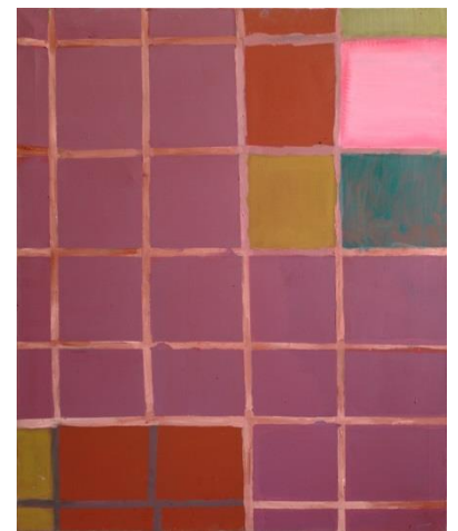
Christian Fichtl, 103-0869, Öl auf Leinwand, 120x100 cm, 2015

Dorothea Konviarz Stiftung // Stiftung Ursula Hanke-Förster // Helmut-Thoma-Stiftung // IBB Preis für Photographie // Meisterschülerpreis des Präsidenten // NaFöG // Regina Pistor Preis // Schulz-Stübner-Preis // Stiftung Ulrich und Burga Knispel