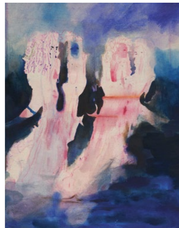
Caryatids II, oil, watercolor, and fineliner on canvas, 58 cm x 45 cm, 2025