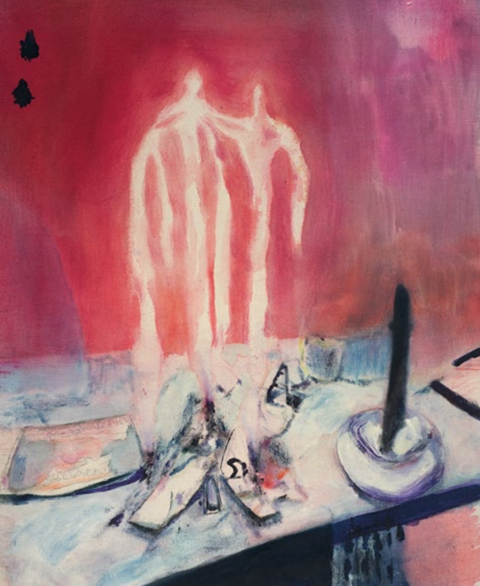
Untitled, oil, watercolor, and colored pencil on canvas, 55 cm x 45 cm, 2025

To show but not fully reveal is a delicate balance. It can draw the viewer in or leave them searching for orientation. Vero Haas's paintings from the series us – two places at the same time operate along this threshold: they disclose just enough to provoke curiosity, inviting the eye to search for a steady line that continually withdraws into translucent forms, shifting shapes, and suggested figuration.