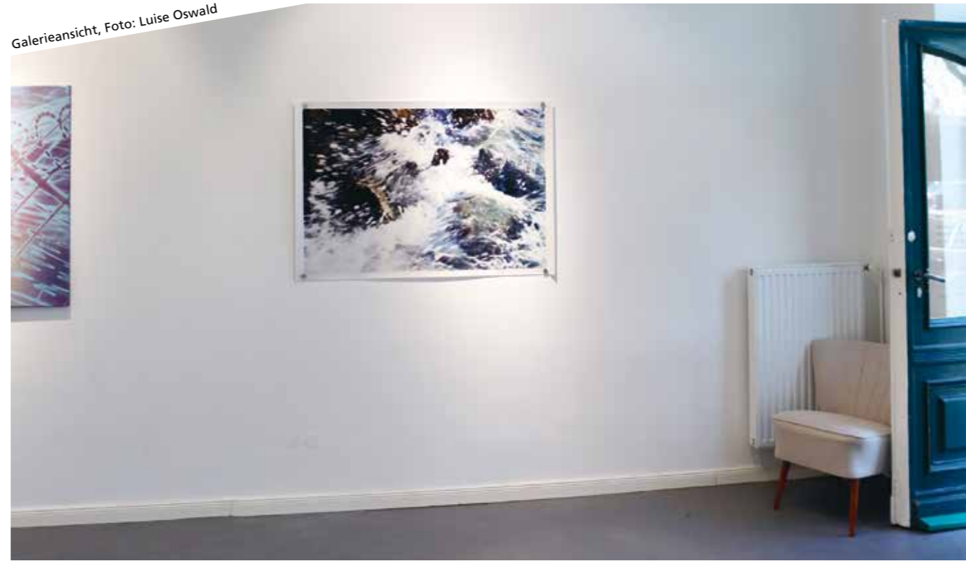
Galerieansicht, Foto: Luise Oswald

wer wann überhaupt Zeit hat. Manche haben schon eine Ausstellung oder eine Preisverleihung und die Werke sind nicht verfügbar in dem Zeitraum, für den ich plane. Weil ich durch die Galerie auch super viele Leute kennenlerne und die Bubble sich vergrößert – explodiert auch die Excel-Tabelle. Also lasse ich es sich entwickeln, so natürlich wie möglich, und vieles fügt sich wirklich irgendwie, was merkwürdig ist. Bei den ersten beiden Ausstellungen war es auch schon so. Es war total bereichernd, gleich die erste Ausstellung mit Studierenden aus Hamburg zu machen, weil ich Kontakte zur HFBK und zu den Fachklassen dort hatte.