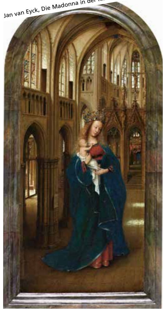
Jan van Eyck, Die Madonna in der Kirche, um 1437/40