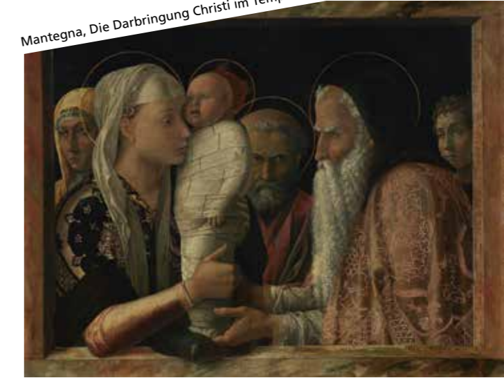
Mantegna, Die Darbringung Christi im Tempel, 1454

linke Hälfte eines Diptychons, d. h. es gab noch eine zweite Tafel auf der rechten Seite. Vielleicht mit dem Stifter. Wenn das Licht von rechts kommen würde, fiel es vom Stifter aus auf die Madonna. Vollkommen ausgeschlossen. Aber die Kirche musste so ausgerichtet sein, dass man zum Chor schaut, zum Allerheiligsten. Würden wir zum Ausgang blicken, dann stünden wir ja auf dem Altar. Das geht natürlich nicht. Also hat van Eyck das aus kompositorischen Gründen so gelöst. Wobei man auch wissen muss, diese Kirche hier hat es nie gegeben.