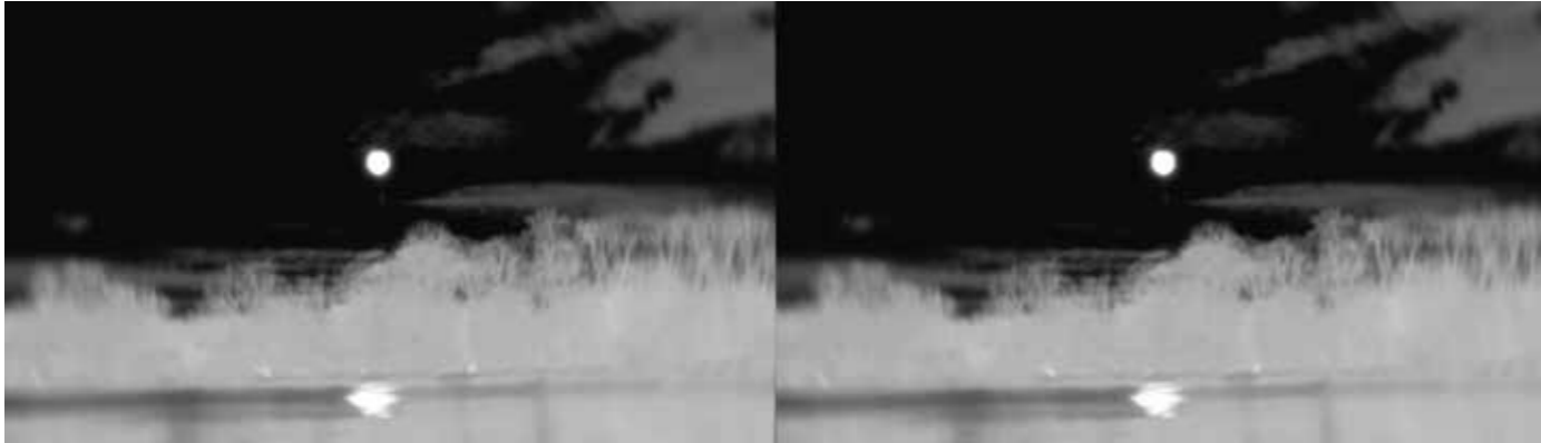
Lena Kocutar, „the sun that fell into the water“, 2025 2-Kanal-Video-Installation, Ton, 21 min., Birkenholzplatten, Keramik, elektrodynamische Lautsprecher, Kupferkabel

Die Arbeit reflektiert die menschliche Präsenz im Spannungsfeld zwischen Intimem, Mechanischem und Politischem. Ausgangspunkt ist die Geschichte eines Wasserkraftwerks, erzählt aus der Perspektive eines Kindes – ein Ort, an dem Erinnerung, Technologie und Macht ineinandergreifen.