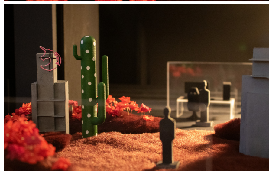
Caption, 0000 Caption, 0000 Caption, 0000